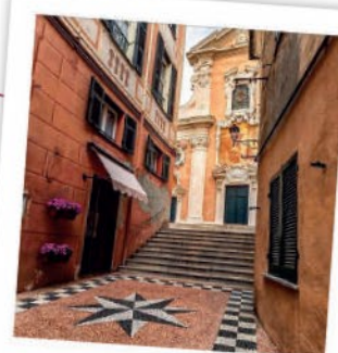
Giro in centro

Jorn House Museum, the complete set of architecture, nature, ceramics, and paintings has been created by one of the most important artists of the 20th century: Asger Jorn.