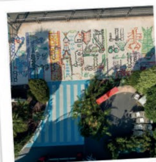
Passeggiata degli Artisti

M.u.DA Exhibition Center, an inspirational place with modern and contemporary art sculptures and paintings created by great artists of the 20th century.